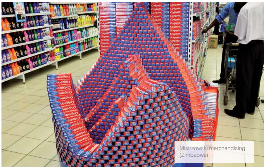
Mistrzowski merchandising (Zimbabwe)