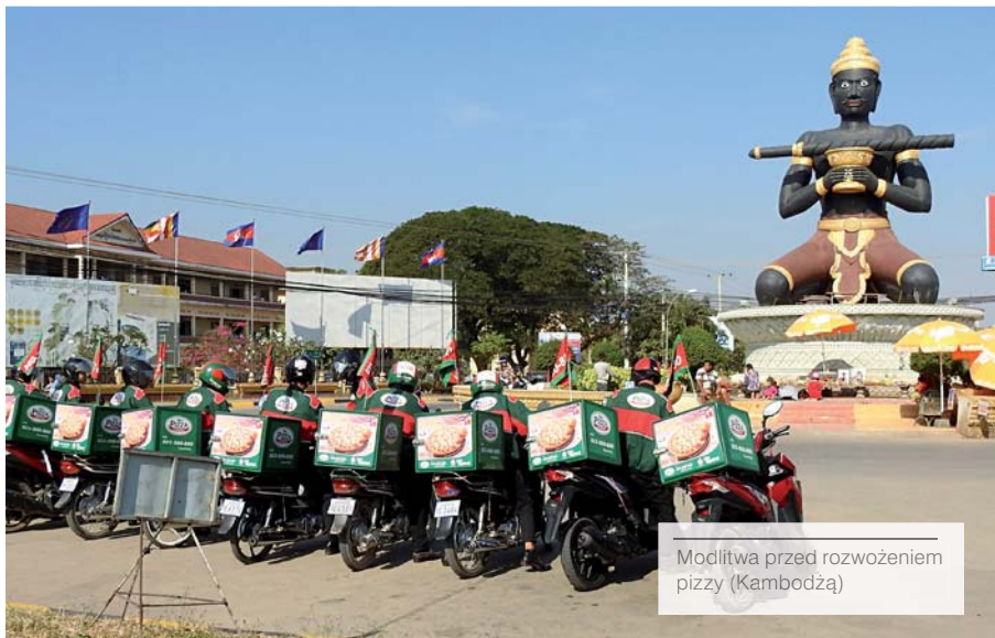
Modlitwa przed rozwożeniem pizzy (Kambodża)