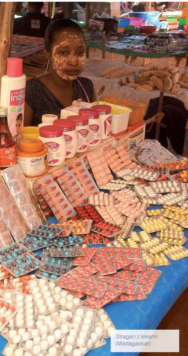
Stragan z lekami (Madagaskar)