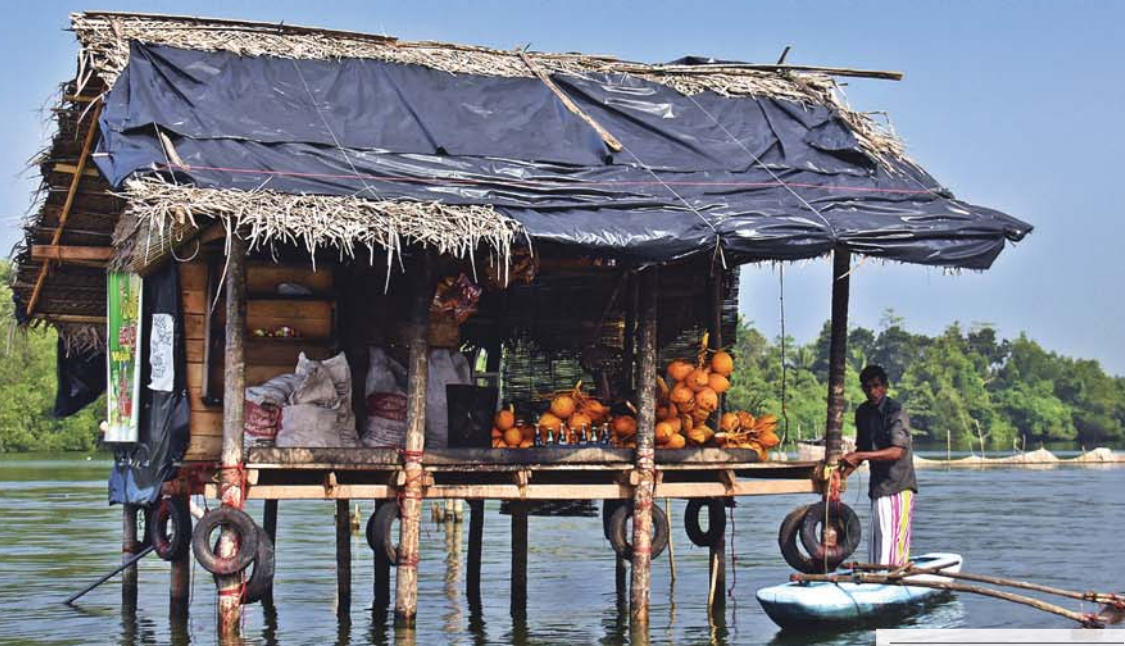
Sklep na rzece Madu Ganga (Sri Lanka)

W poprzednich wydaniach naszego czasopisma opisywałem wrażenia powstałe podczas obserwowania egzotycznych zwierząt oraz poznawania codziennego życia autochtonicznej ludności. Doznania, którymi dzisiaj się podzielę, powstały dzięki patrzeniu na otaczający świat oczami akademika-marketingowca.