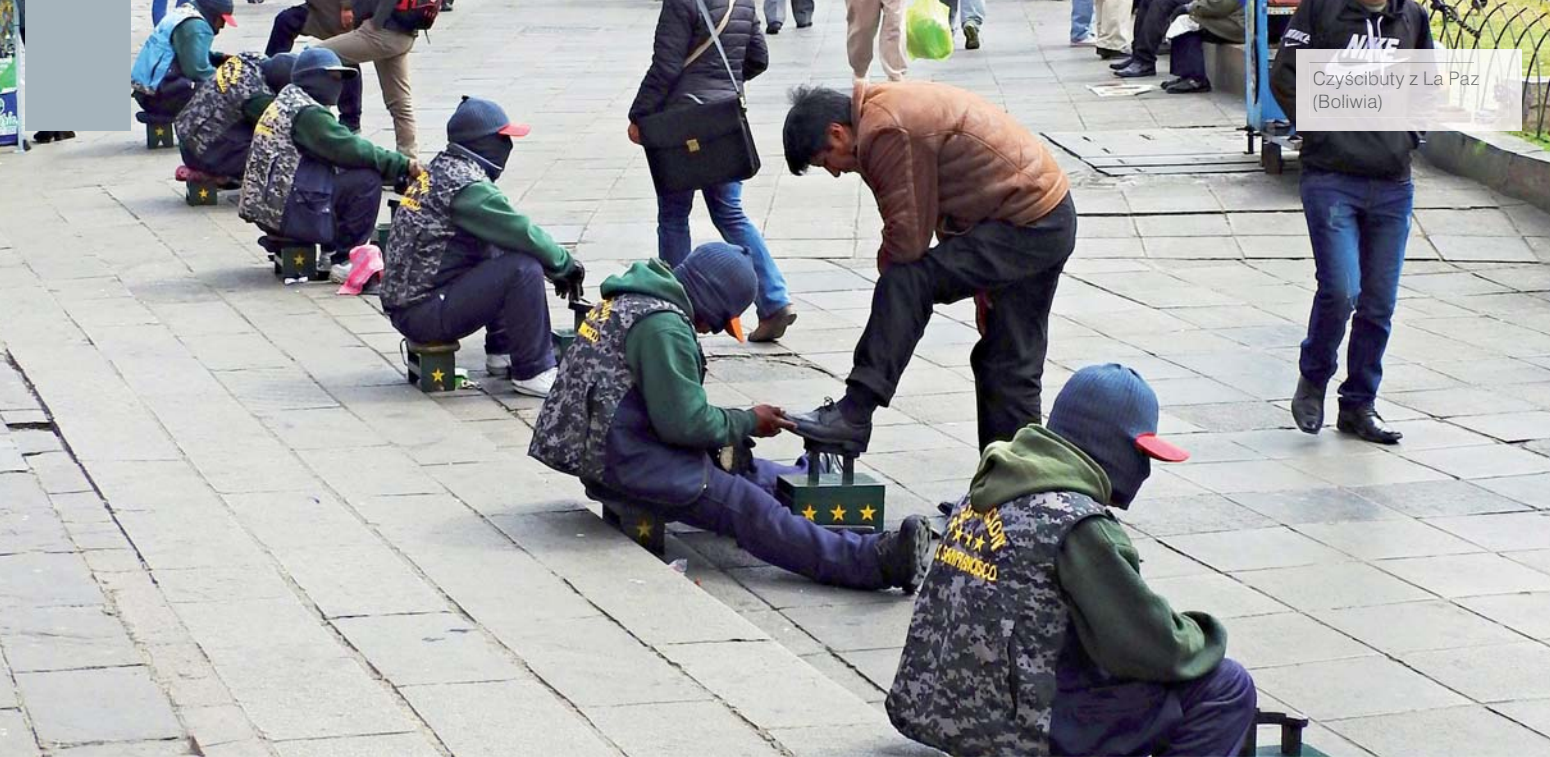
Czyszcibuty z La Paz (Boliwia)